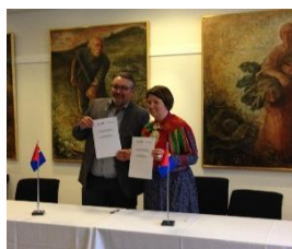
GOVVA: GÁIVUONA SUOHKAN

Sámediggi juolluda jahkásaččat doarjagiid suohkaniidda vai buoremus lági mielde sáhttet čađahit sámelága giellanjuolggadusaid. Ulbmil guovttegielatvuođadoarjagiin lea suodjalit, nannet, ovddidit ja ovdánahttit sámegiela almmolaš oktavuodain.