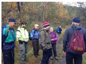
GOVVA: GÁIVUONA SUOHKAN

Iežamet báikkálaš servvodagas leat posiitiiva guottut ja rievdan ipmárdus sámegeillii ja kultuvrii ja váikkuhan čalmmustahttima, ovddideami ja ovdáneami mánggakultuvrrat gáivunkultuvrra. Sámi institušuvdna ceggen dego Davvi álbmogiid guovddáš, Sámi girjerádjobálvalus, Sámediggi, Riddu Riđđu festivála ja Giellasiida, ja maiddá eanet oainnus sámi almmolašvuohhta sámelága ja sámi oahppoplána sisafievrrideami bokte, sámi leavgabeivviiguin čalmmustahttit sámegeiela ja kultuvrra, sámi báikenammagalbbat, almmolaš visttiid galbet, sámegeielat neahttasiidu ja almmuheamit, sámeálbmotbeavvi ávvudit, lea váikkuhan ahte olbmui lea stuorat didolašvuohhta iežaset duogážii ja historjái dan guvlui gosa lea gullevašvuohhta.