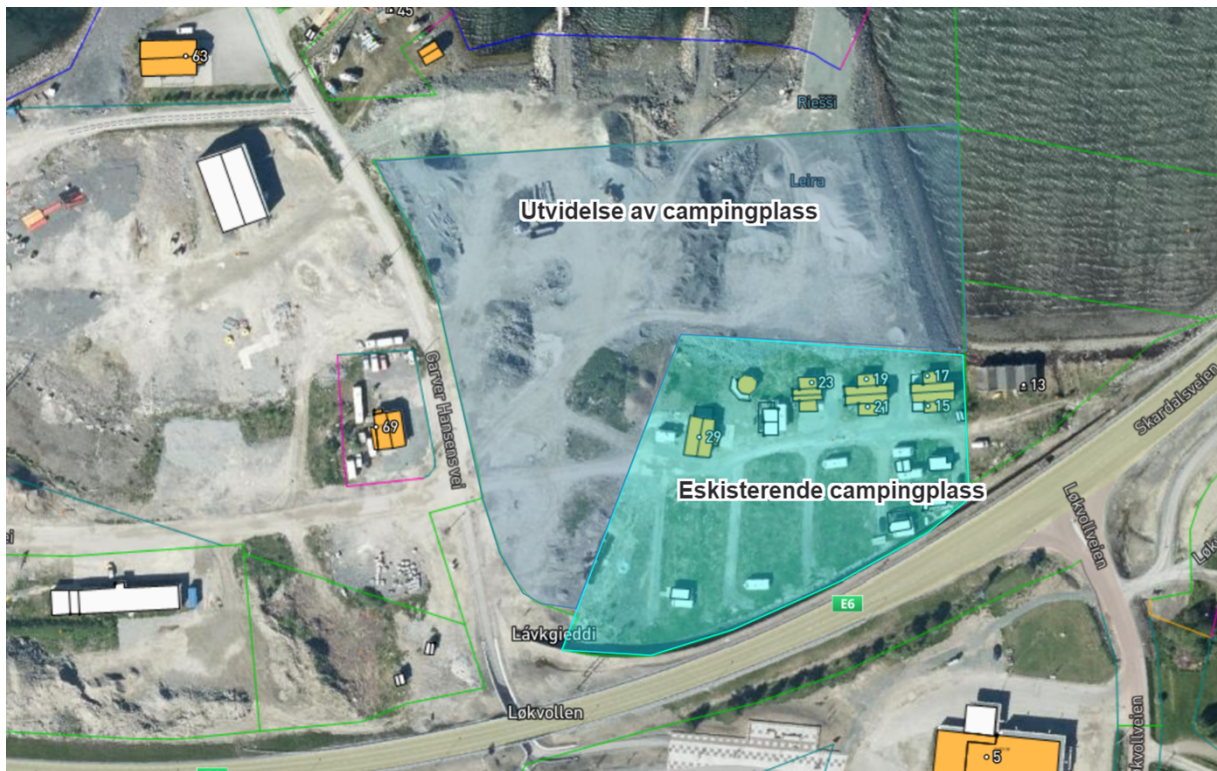
Fig. 2 – Flyfoto reguleringsområdet