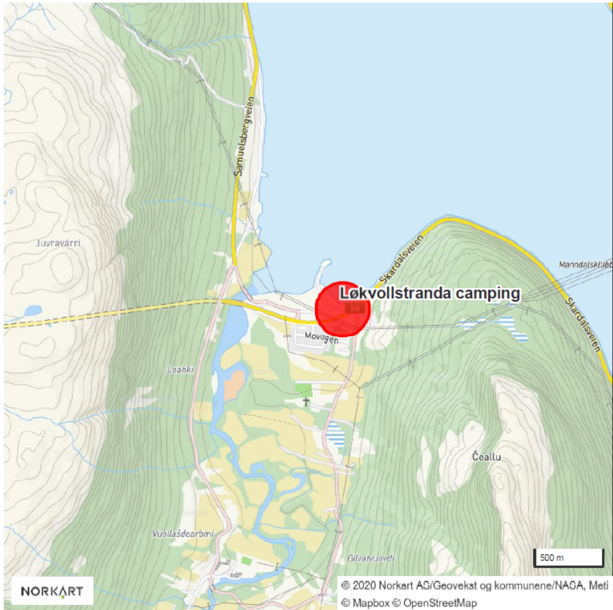
Fig. 1 – Oversiktskart Løkvoll