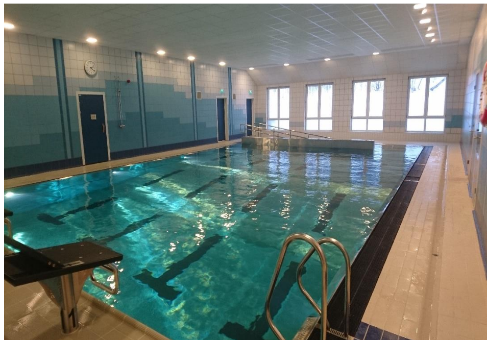
Nyrenovert basseng ved Eidebakken skole, Lyngseidet

Fordelt beløp: kr 58 301 975,- Søknadsbeløp: kr 222 540 622,- Godkjente kostnader: kr 1 747 033 567,-