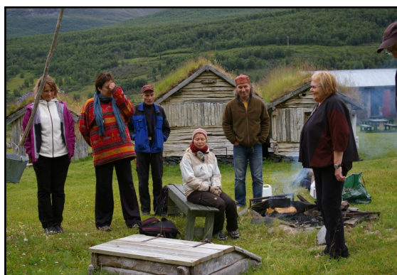
Sámi giellalávgu Miessegieddis