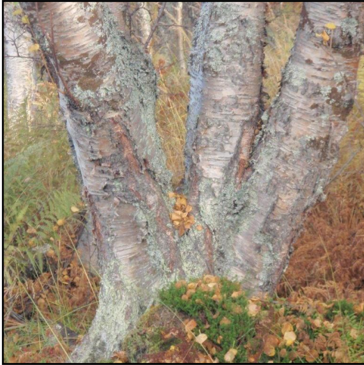
Davvi-Romssa – golmma čeardda deaivvadanguovlu

Guhkkin davvin, gos leat oanehis gaskkat čiekŋaleamos suonain mihtilmas duoddariidda. Gaskal siseatnama ja rittu, doppe gos leat viiddis duoddarat ja go luosat bákŋet jogain –juste doppe don gávnnat Davvi-Romssa.