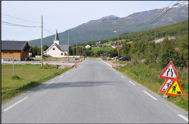
Ođasmáhttimis Biertavári guovddáža

Gáivuona suohkana doaibma- ja ovdánahttin veahkeha du huksenáššiin, opmodatáššiin, ja eará teknihkalaš bálvalusaiguin. Dát bálvalusat leat sihke sin várás geat juo orrot suohkanis ja sin várás geat áigot deike fárret.