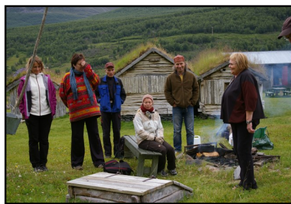
Samisk språkbud på Holmenes sjøsamiske gård