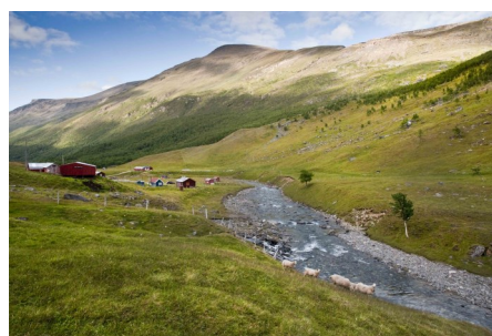
Ruovddáš i Manndalen