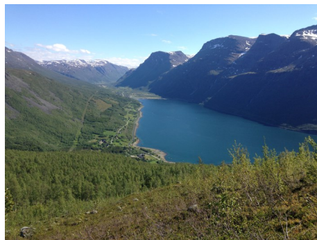
Indre Kåfjord sett fra Bjørketinden, Trollvik