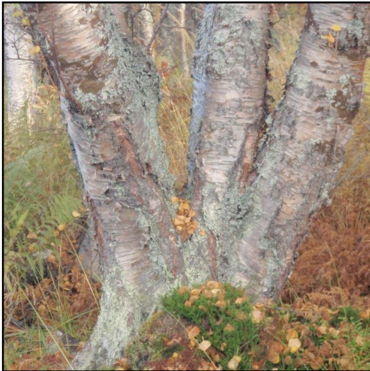
Nord-Troms - et tre stammers møte.

Langt mot nord, der avstanden er kort mellom de dypeste fjorder og det villeste alpe-landskap. Mellom innland og kyst, der viddene ligger vidstrakte og laksen spretter i elvene – akkurat der finner du Nord-Troms.