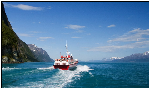
Potensiale for reiseliv

Kåfjord har de siste årene hatt et spesielt fokus på utvikling av reiseliv og kultur- og naturbaserte næringer. Det mest profilerte tiltaket som er initiert i den forbindelse er bygging av Gorsabrua i Kåfjorddalen.