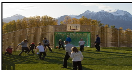
Ballbinge i alle bygder