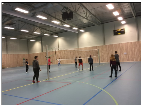
Førjultreff for ungdom i Kåfjordhallen, Olderdalen

Kåfjordsamfunnet tilbyr et variert fritidstilbud for deg som innbygger, uavhengig av alder, interesser eller fysiske forutsetninger. Enten du ønsker å være fysisk aktiv, lokalpolitisk aktiv eller kreativ vil du trolig finne et tilbud som passer for deg.