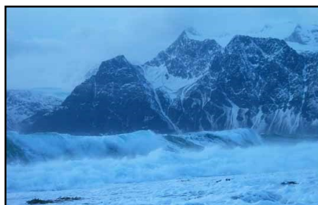
Bølger etter "Narve"